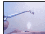
Effet mémoire simple sens